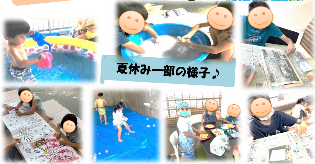
夏休み一部の様子♪