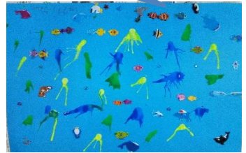
8月21・22日 宇治市野外活動センターアクトパル宇治にて！