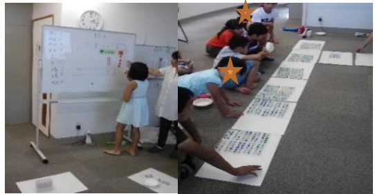
(どちらのやかんの方が水がおおいかな?)